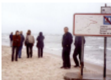
Besök på Grenen